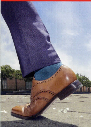
Sempre in piedi